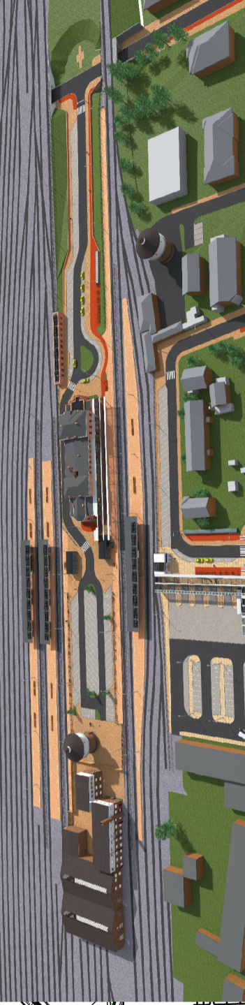
KONCEPCJA ZAGOSPODAROWANIA TERENU WĘZŁA INTEGRUJĄCEGO W CHOJNICACH