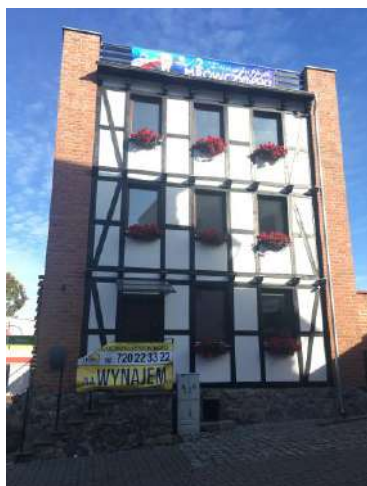
Obiekt odrestaurowany w 2017 r.