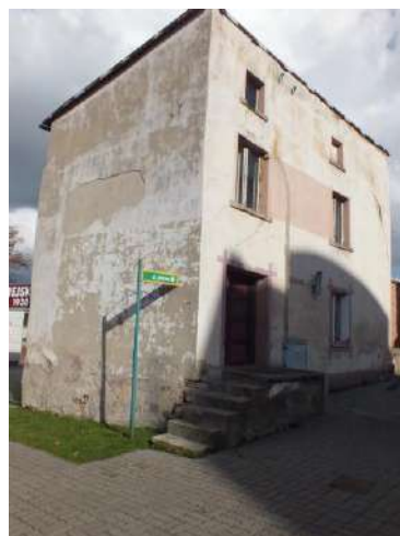
Stan przed konserwacją