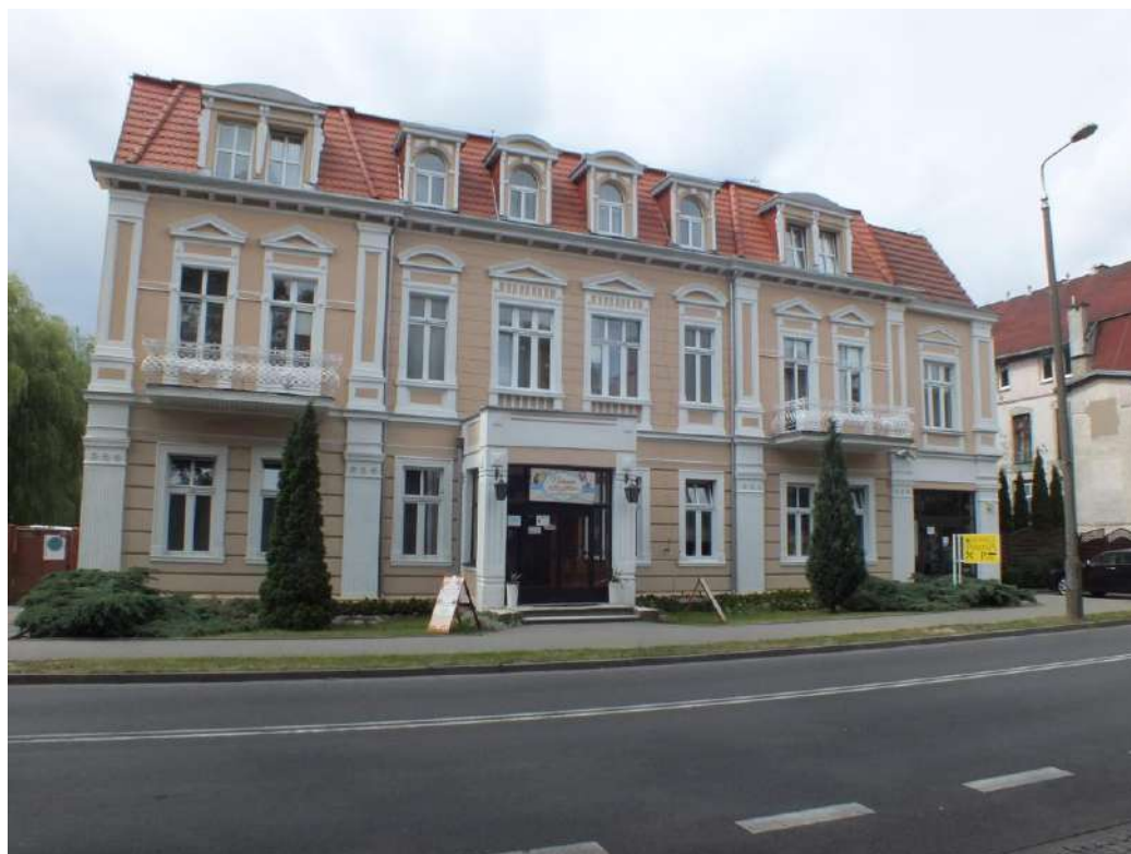
2018 r. budynek odrestaurowany przy wsparciu miasta