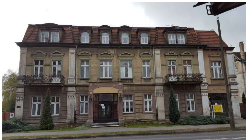
2017 r. budynek przed pracami konserwatorskimi

Budynek wzniesiony na przełomie XIX/XX w. użytkowany, jako dom mieszkalny i hotel. W fasadzie frontowej zachował formy historyzujące, nawiązujące do klasycyzmu. Frontową elewację budynku ozdabiają m.in. ryzality, pilastry, gzymsy, fryzy, bonie, płyciny podokienne imitujące balustradki oraz kute balkony w formie koszy. Budynek został odrestaurowany w 2018 r. przy wsparciu dotacją z miasta .