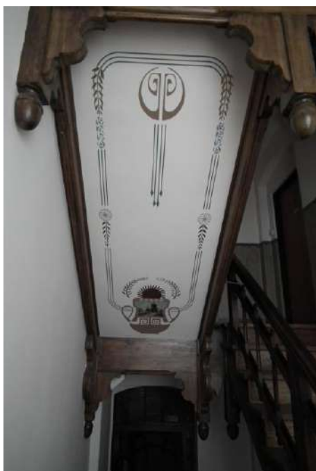
Secesyjna klatka schodowa po pracach konserwatorskich.