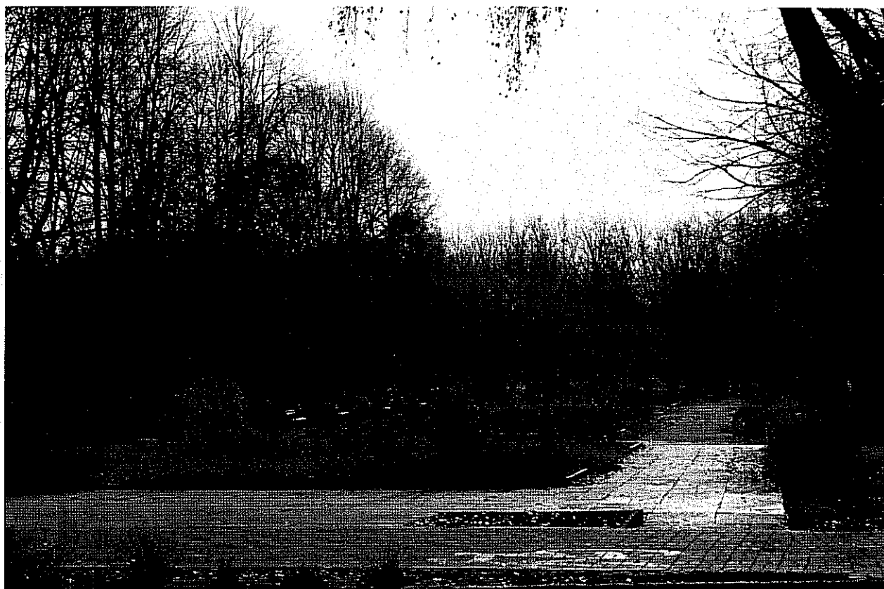
Park Tysiąclecia – widok od ul. Sukienników