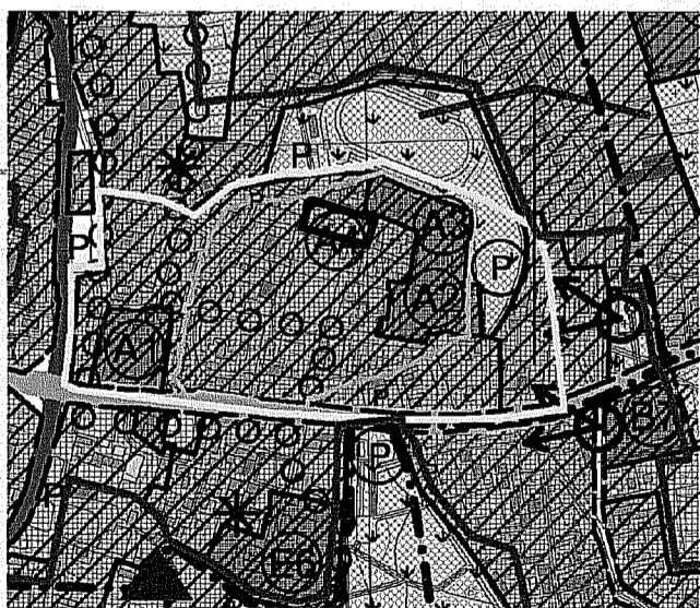
WYRYS ZE STUDIUM UWARUNKOWAŃ I KIERUNKÓW ZAGOSPODAROWANIA PRZESTRZENNEGO MIASTA CHOJNICE

PLAN ZOSTAŁ UCHWAŁONY UCHWAŁĄ RADY MIEJSKIEJ W CHOJNICACH NR V/62/11 Z DNIA 21.03.2011 R. O PUBLIKOWANIE W DZIENNIKU URZĘDOWYM WOJEWÓDZTWA POMORSKIEGO NR 1389, POZ. 4 Z DNIA 14.03.2011 R.